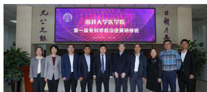
南开大学医学院第一届骨科前沿进展研修班