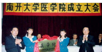
南开大学医学院成立大会