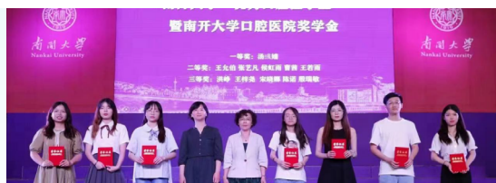
南开大学口腔医院领导为“优秀口腔医学生”颁发奖学金

口腔医学专业于 2009 年通过教育部审批，与天津市口腔医院联合办学。该专业旨在培养系统掌握基础医学、临床医学及口腔医学的基本知识和技能，具有国际视野及较强的创新精神和基本的口腔临床诊疗能力，有良好的人文素养和职业道德，在医疗机构从事口腔常见病、多发病诊治和预防工作，以及口腔医学相关教学和科研等工作的口腔医学专门人才。该专业学制 5 年，学生毕业后授予医学学士学位。