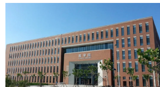
津南校区医学院楼

学院目前拥有临床医学博士学位授权点、临床医学博士专业学位授权点；临床医学、口腔医学、食品科学与工程 3 个硕士学位授权点；临床医学、口腔医学 2 个硕士专业学位授权点；临床医学（“5+3”一体化）、口腔医学、智能医学工程、眼视光医学 4 个本科专业。其中，临床医学专业为国家级一流本科专业建设点，口腔医学、智能医学工程、眼视光医学专业为省级一流本科专业建设点。