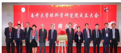
南开大学眼科学研究院成立仪式

2023 年以来，学院成功举办医工融合学习班，分别就骨科学、眼科学与视光学、口腔医学的前沿进展做专题交流，促进医教研融合发展。