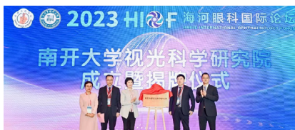
南开大学视光科学研究院成立仪式