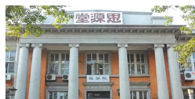
思源堂 (八里台校区医学院楼)