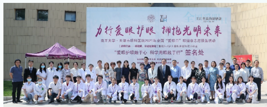
南开大学附属眼科医院举办全国“爱眼日”眼健康志愿服务

眼视光医学专业于 2019 年 3 月通过教育部审批，当年开始招生，与天津市眼科医院联合办学，是服务眼视光方向高级医学人才培养的临床医学类专业。该专业整合临床眼科学、视光学、光学、新材料科学、大数据科学以及人工智能科学等新兴学科，是目前国家与社会急需的专业人才培养方向，是学院着力打造的“新医科”专业。该专业致力于与国际接轨，已经与多家国际知名医学院校建立良好合作关系，并将继续在人才培养及学科建设上开展全方位国际合作。该专业学制 5 年，学生毕业后授予医学学士学位，符合《执业医师资格证》报考条件。