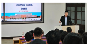
医学院院长张英泽院士为本科生 开设讲座