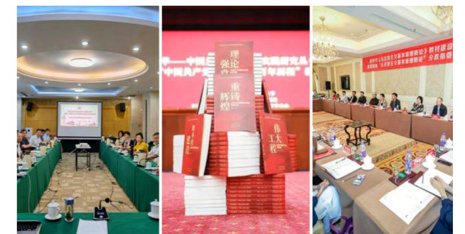
举办各类学术科研活动