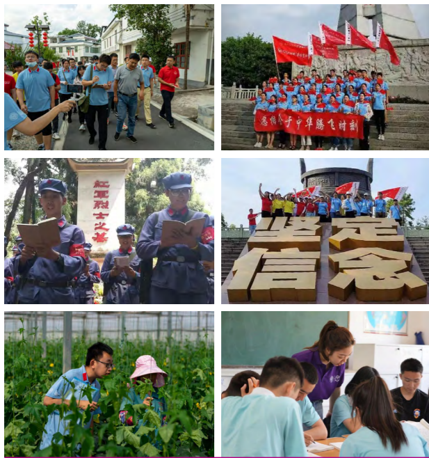
优秀学生代表与“师生四同”暑期社会实践

贯彻南开大学“知中国，服务中国”的办学宗旨，在推进“师生同学同研、同讲同行”中，培育学马信马传马的时代新人。党团班、学生社团开展形式多样的社会实践，连年荣获校级、市级各项荣誉，相关事迹被新闻联播、焦点访谈、《光明日报》等主流媒体报道。