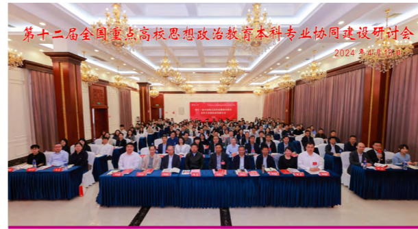
学习贯彻习近平文化思想暨纪念思想政治教育专业建立四十周年 --第十二届全国重点高校思想政治教育本科专业协同建设研讨会

学院下设马克思主义理论和思想政治教育 2 个本科专业，均为国家级一流本科专业建设点。学院全面承担全校本科生、硕博研究生的思想政治理论课教学，是全国最早开设马克思主义理论类本科专业的单位之一，也是全国首批获得马克思主义理论一级学科博士学位授予权单位，拥有从学士、硕士到博士的完整人才培养体系。在马克思主义理论一级学科下设全部二级学科，并在中共党史党建、科学社会主义与国际共产主义运动学科招收硕士和博士，同时设有马克思主义理论学科博士后流动站。