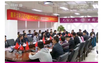
焦点访谈专题报道： 思政课：要“活”才能“火”

举全院之力办好两个本科专业，学院知名教授、资深专家均开设本科专业课程，师生共同探索理论真谛。秉承开门办学理念，邀请本校哲学、政治经济学、法学等相关专业教师开设课程，以及北大、清华、人大、武大等其他院校名师开办讲座，举办各类高端学术研讨会，确保学生直接聆听名师授课。