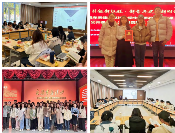
本硕博一体化学术活动

学院为每名本科生配备学术导师，参照研究生教研方式提供个性化培养。鼓励并推荐优秀学生通过免试攻读硕士研究生、直攻博等方式进行深造，成长为优秀的马克思主义理论人才。推动本、硕、博课程有效衔接，完善本硕博一体化学术活动机制，打通影响一体化培养的关键环节。