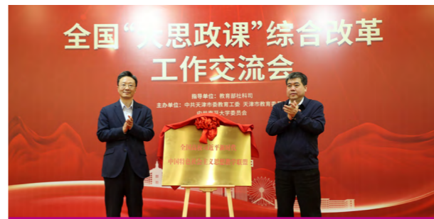
“全国高校习近平新时代中国特色社会主义思想教学联盟”授牌仪式

2020 年，学院获批教育部主管马克思主义理论类综合期刊《马克思主义理论教学与研究》。学院马克思主义基本原理课程虚拟教研室获批首批国家级虚拟教研室建设试点，“21 世纪马克思主义研究省部共建协同创新中心”获教育部认定，还拥有全国高校思想政治理论课教师理论研修基地、教育部习近平新时代中国特色社会主义思想研究中心基地、天津市人文社科重点基地马克思主义研究中心等教学科研平台。同时，学院牵头成立了全国高校习近平新时代中国特色社会主义思想教学联盟、天津市学校习近平新时代中国特色社会主义思想研究联盟。习近平总书记在视察南开大学时，翻阅了依托研究联盟、由我院教师领衔编写的《习近平新时代中国特色社会主义思想“三进”教学指导方案》并给予肯定。