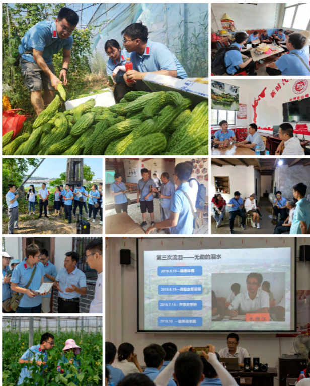
脱贫攻坚暑期调研