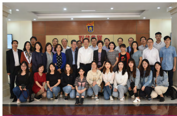
学院师生代表赴越南与河内人文与社会科学大学师生代表合影