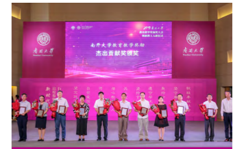
学院多位教师荣获 首届南开大学教育教学奖

学院师资队伍实力雄厚，拥有国务院学科评议组成员、教育部高校思政课教学指导委员会委员、教育部“长江学者”、国家“万人计划”、中宣部文化名家暨“四个一批”入选者、国务院特殊津贴专家等人才称号 20 余人次。获全国思政课优秀教师、全国高校思政课教学能手、全国高校思政课教学标兵、全国高校思政课影响力人物、宝钢教育奖等称号 10 余人次，天津市教学名师、天津市优秀教师、天津市思政课教师年度影响力人物等称号 10 余人次。多名教师在全国高校青年教师教学竞赛、全国高校思政课教学展示活动、天津市高校思政课青年教师教学技能大赛等活动中获奖。多名教师荣获国家级教学成果奖，在马克思主义理论学科教育教学和科学研究领域有着广泛影响。