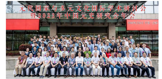
元代国家与多元文化国际学术研讨会 暨 2023 年中国元史研究会年会

级一流课程。同时，为适应跨学科教学的需要，设“科学技术史”微专业，学院还建有“数字史学实验教学中心”，并与校博物馆共建“文博考古实验教学中心”。