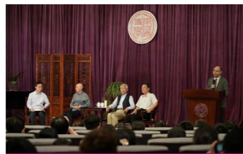
清史大家冯尔康、阎崇年南开对谈

主要课程有： 中国古代前期史、中国古代后期史、史料学与学术训练、先秦史、秦汉史、魏晋南北朝史、隋唐五代史、宋史、元史、明史、清史、中国近代史、20 世纪中国史、史学概论、中国史学史、史学写作、历史文选、历史学电子资源应用、中国政治制度史、中国经济史、史学通识与前沿、中国环境史、历史地理、中国婚姻家庭史、中国风俗史、中国社会史、医疗社会文化史导论、中国城市史、中国近现代政治制度史、中国近代社会转型研究、中美关系史、中日关系史等。