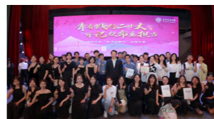
历史学院传云合唱团荣获“五月的鲜花”校级合唱比赛一等奖