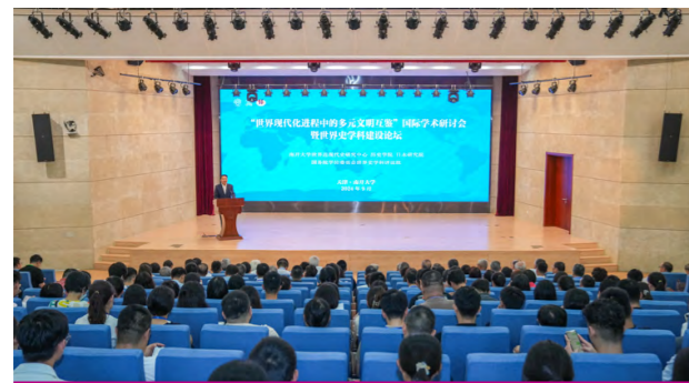
“世界现代化进程中的多元文明互鉴”国际学术研讨会

主要课程有： 世界上古中古史、世界近现代史、外国史学史、外国史学名著选读、史学网络资源检索与应用、古希腊史、古罗马史、拜占廷史、基督教史、东欧国家文化艺术史、美国史、日本史、德国史、英国史、俄罗斯史、加拿大史、美国外交史、日本外交史、拉丁美洲史、拉美外交史、专业英语、俄语、西班牙语、拉丁语、希腊语等。