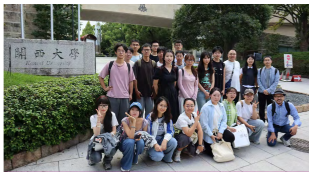
学生赴日本关西大学交流

历史学院有着广泛的海外影响，国际化程度高。学院现有外籍专任教师 4 人，港澳台专任教师 3 人，与海外知名高等学府和学术机构开展稳定的合作与交流。学院每年有 10 余名教师在海外各高校及研究机构讲学、访问及合作研究，数十人次参加海外学术活动。每年邀请数十名国内外史学家来访进行学术交流，极大丰富了学院的学术氛围，收到了学术交流的良好效果。每年都有若干名本科生获选教育部留学师资“百人计划”资格，赴世界知名高校深造和交流。另外还有多种机会前往欧美、日本、香港、台湾等国家和地区的著名学府进行学习访问。