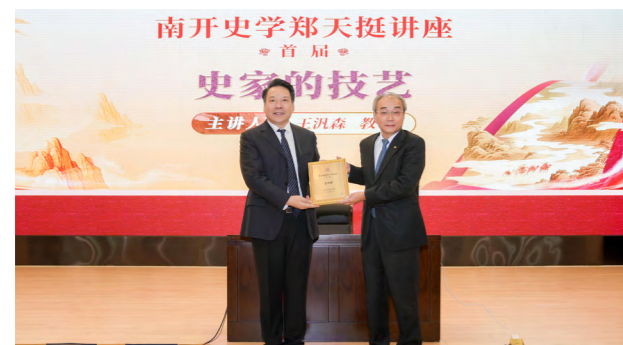
首届“郑天挺讲座”：王汎森南开开讲“史家的技艺”