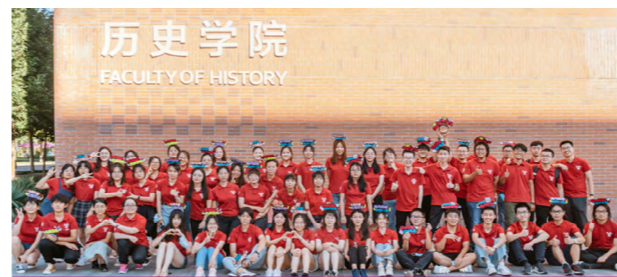
历史学院迎新志愿者合影

历史学院注重培养学生的理论思维和发现问题、分析问题、解决问题的能力，并以此为基础，培育学生的综合能力、学术创新精神和历史人文情怀。近年来，学院不断强化学生学术科研训练、拓展专业实习实践平台，全方位提升学生的综合竞争能力，为国家党政机关、大型企业、教育文化行业、人文社会科学研究机构等重点领域和行业输送了大批优秀人才，就业率在全国高校同类专业中名列前茅。