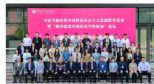
联合全国 22 所高校历史学科开展习近平新时代中国特色社会主义思想联学联悟“强国建设中的历史学科使命”论坛