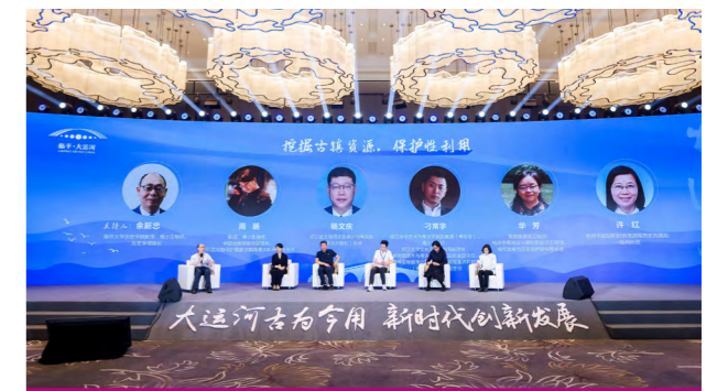
南开大学中国现代化乡村工作站在杭州临平挂牌

学院始终秉承“惟真惟新，求通致用”的治学传统。在专业教学和人才培养中，一贯重视基础课程建设，注重研究实践训练，以课程思政优秀典型引导课程改革，强调宽、博、专、精有机结合，倡导自主学习和独立思考，致力于培育学生的综合能力与价值塑造、学术创新精神与历史人文情怀，提高他们的理论思维、史料解读、问题分析、论文写作、语言表达、社会交往和团队协作等多种实际能力。近年来，学院大力推进“新文科”建设，通过继承创新、交叉融合、协同育人等途径，促进多学科交叉与深度融合，以打造文科复合型人才，培育具有引领能力的新时代社会科学家，作为历史学拔尖人才培养方面的主攻方向。