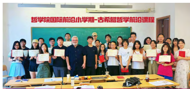
国际前沿小学期课程