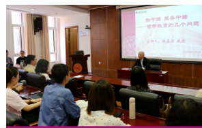
知南开·知哲学讲座

哲学院邀请海内外知名学者为学生开设专业学术讲座。针对每一届本科生开设“知南开·知哲学”和“哲学与职业规划”系列讲座，邀请知名校友和专家对学生做专业学习和就业方面的针对性指导。学生活动丰富多彩。坚持近二十年举办“哲学文化周”系列活动，已成为南开校园活动一大品牌。