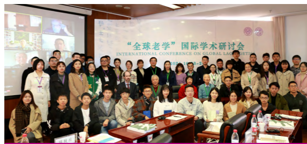
全球老学国际学术研讨会