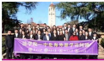
法学院-中伦海外游学访问团

法学院重视对学生的就业指导工作和职业技能培训，积极开展法律职业发展教育。学院成立了学生职业发展中心，从精准就业调研、就业信息传递、就业指导教育、加强校企合作等角度促进学生就业。开设“法职启航”南开法学就业指导系列公开课，邀请校友及校外实务专家主讲，开设“法硕·同职”校友系列访谈、朋辈职零距离