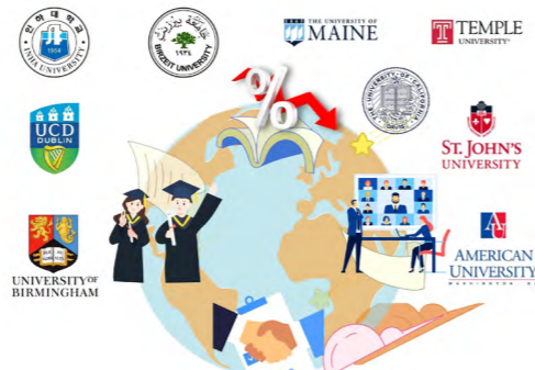
通过学费减免、联合培养、合作研究、师生互访等方式与多所国外高校法学院建立合作关系

法学院已与多所境外知名大学法学院签订硕士联合培养协议，选拔、资助优秀本科生赴海外深造。近五年，有近 30 名本科生通过参与校、院两级交流项目出国（境）访学交流。