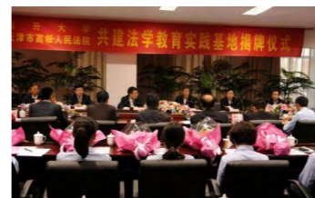
与天津市高级人民法院共建 法学教育实践基地

法学院依托百年南开深厚的文化底蕴和优良的办学传统，专业教育以习近平法治思想为指导，坚持立德树人、德法兼修，以培养德才兼备，专业扎实，具有公能特色的卓越法治人才为根本任务。