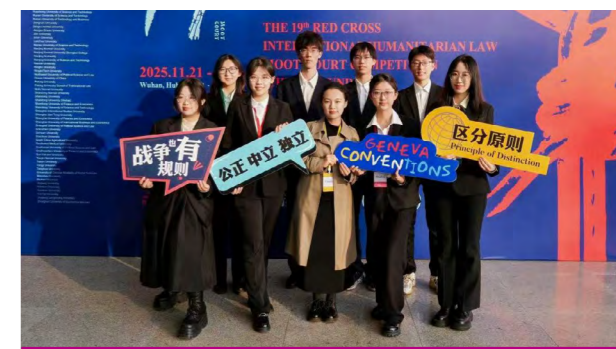
南开大学法学院代表队在 2025 年第 19 届国际人道法模拟法庭竞赛中获得全国一等奖

南开法学始终坚持以能力培养为中心，强调“课堂教学、创新科研、校园文化、社会实践”四位一体的人才培养模式。重视选拔、培养学生参加各类法学专业赛事，依托模拟法庭类课程教学、学术类竞赛活动以及学院辩论赛，打通理论学习与实操训练等教学环节。在历年的比赛中，南开法学院代表队多次取得优异成绩。在国际刑事法院（ICC）中文模拟法庭比赛中，2024 年获全国三等奖；2025 年获全国一等奖、最佳辩方书状奖，并成功晋级荷兰海牙国际赛段；2026 年获全国一等奖，晋级荷兰海牙决赛。在国际人道法模拟法庭竞赛中，2023 年获第 17 届全国一等奖与控方最佳书状第一名；2024 年获第 18 届全国二等奖；2025 年获第 19 届全国一等奖、亚太赛八强。在国际投资模拟仲裁大赛中，2025 年获深圳杯全国二等奖、亚太赛四强。在“中国 WTO 模拟法庭竞赛”中，2024 年获全国二等奖。在家事法与行政法领域的模拟法庭比赛中，2024 年获“安嘉杯”全国高校家事法模拟法庭最佳文书奖；2026 年获第四届“中间杯”全国大学生行政法模拟法庭大赛二等奖。在知识产权领域的比赛中，2026 年获全国大学生版权征文一等奖。