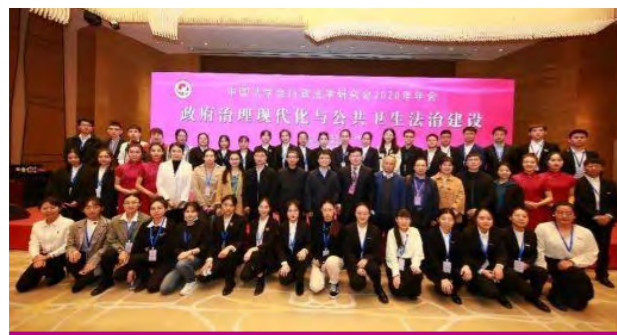
承办中国法学会行政法研究会 2020 年年会

法学院积极探索与兄弟院校在本科教学和人才培养方面的合作，2013 年起，法学院每年派出约 20 名本科生到中国政法大学、对外经济贸易大学进行互相承认学分的交换培养。通过广泛争取社会支持和校友资源，法学院牵头组织“中伦海外公益游学项目”，资助学生赴美国、新加坡、中国香港等地世界知名高校法学院、法律实务部门研学；汇聚多方力量设立“岳成奖学金”“人本奖学金”“煦朗奖学金”“江平击水奖学金”“君利奖学金”社会奖助学金和“点亮律师梦想”项目等，近五年累计资助 300 余名学生。