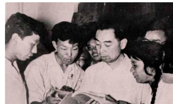
1959 年 5 月 28 日，周总理第三次重返母校视察，听外文系同学读书

目前，学院正在与英国、澳大利亚、法国等知名高校协作，推进 FAS/FSE 的国外合作办学项目。