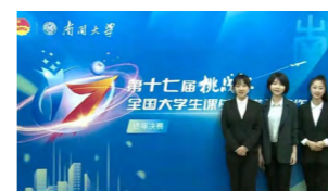
经院学子荣获全国大学生“挑战杯”特等奖

经济学院学科专业门类较为齐全，拥有学士、硕士、博士等多层次教学和学位授予权。学院设置经济学系、国际经济贸易系、财政学系、国际商务系四系，以及经济研究所、国际经济研究所、数量经济研究所等七个研究所。现有全日制在校学生共计 2610 人，其中本科生 1362 人、博士研究生 532 人、科学硕士 461 人、专业硕士 255 人。