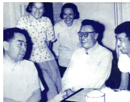
周恩来总理视察南开时与经济研究所教师亲切交谈

经济学科是南开大学的传统优势学科，历史悠久。1919 年，张伯苓创校，设立文、理、商三科；1923 年，南开大学文科下设经济学系、创立经济学科；1931 年由经济学系与经济研究所组建经济学院，开中国大学之先；1935 年起开始培养经济学研究生。1978 年，南开大学经济学院在全国高校中率先重建了金融学等本科专业，新建了国际经济、保险学等改革开放中急需的新专业。近年来，南开大学应用经济学入选“双一流”建设学科，经济学院获批四个国家级一流本科专业建设点、首批经济学拔尖学生培养计划 2.0 基地、首批教育部哲学社会科学实验室（试点）中唯一经管类文科实验室，新增数字经济本科专业，已发展成为国内领先、国际知名的经济学人才培养基地、研究创新基地、国际学术交流基地、中国经济改革与发展的重要思想库。