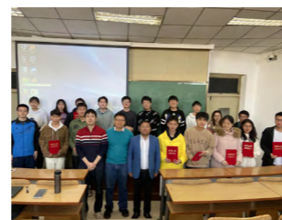
国际经济贸易系“云鹰读书会”

数字经济专业培养具备扎实经济学理论功底和数理基础、拥有开阔视野并通晓数字经济规则的精英人才。学生未来有能力将现代信息、大数据和人工智能等技术熟练运用于现代经贸理论研究和政策应用等领域。