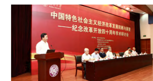
中国特色社会主义经济改革发展与回顾——改革开放 40 周年学术研讨会

经济学院拥有理论经济学、应用经济学两个国家级一级重点学科，均有一级学科博士学位授予权，覆盖经济学门类的 16 个二级学科，设有理论经济学和应用经济学 2 个博士后流动站。