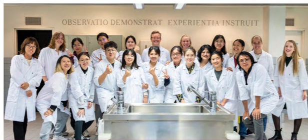
临床医学专业医学生赴挪威科技大学访问合影

项目、挪威科技大学虚拟仿真合作项目、哈佛大学医学院暑期项目等，百余名学生参加国外重要学术会议、访问交流或联合培养。