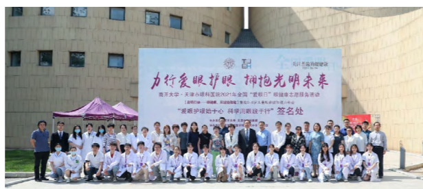
南开大学附属天津市眼科医院举办全国“爱眼日”眼健康志愿服务活动

眼视光医学专业 2019 年开始招生，与天津市眼科医院联合办学，是服务眼视光方向高级医学人才培养的临床医学类专业。该专业整合临床眼科学、视光学、光学、新材料科学、大数据科学以及人工智能科学等新兴学科，是目前国家与社会急需的专业人才培养方向，是学院着力打造的“新医科”专业。该专业学制 5 年，学生毕业后授予医学学士学位。