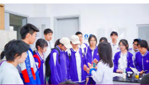
“医学文化节”现场，志愿者为中学生开展医学科普知识讲解