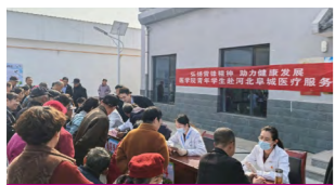
医学院学生医疗卫生志愿服务队赴河北阜城开展健康服务

医学院加强“五育融合”体系建设，以“公能”精神深化人文素质教育。医学院开放日、“公能”实践月、“荣耀医学”年度颁奖典礼把握学生培养关键节点，腹腔镜大赛、解剖图谱大赛、白袍授予仪式等搭建起医学特色文化系列活动，促进学生德智体美劳全面发展。2025 年，学院依托三个南开大学中国式现代化乡村工作站、多省市实践平台和附属医院的资源，组织 220 余名本硕博学生参加各类实践活动，筹备 9 支重点队伍，在多位专业教师、辅导员的共同指导下，开展以课题为依托、专业实践为目标、服务基层为导向的“师生四同”社会实践。