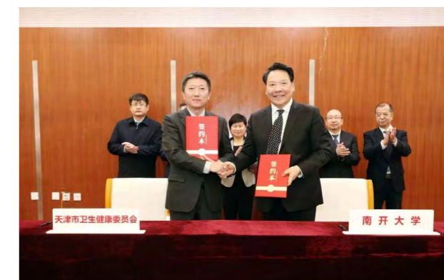
天津市人民医院成为南开大学直属附属医院签约仪式

南开医科初期主要依靠天津市优质医疗资源。2007年，南开大学与中国人民解放军总医院签订战略合作协议，由其承担临床医学7年制后两年研究生阶段培养。2016年，天津市第四医院成为南开大学直属附属医院。2017年，与天津市第一中心医院等12家三甲医院签订战略合作协议，进一步深化教学和科研的合作；2021年，确认天津市第一中心医院、天津市第三中心医院、天津市人民医院、天津市口腔医院、天津市眼科医院、天津市中心妇产科医院、天津市北辰医院为我校附属医院。2024年12月，天津市人民医院成为南开大学直属附属医院，更名为南开大学第一附属医院。学院依托附属医院及临床实践基地建设，联合开展医学科教改革、有力支撑高水平医学人才培养。2025年医学院学子强势斩获“挑战杯”全国大学生课外学术科技作品竞赛特等奖；2025年8月，在RoboCup Malaysia 2025世界机器人公开赛上，智能医学工程专业队伍一举夺得三项冠军，创造历史。