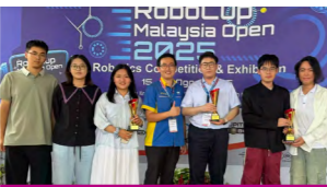
智能医学工程学子在 RoboCup Malaysia 2025 世界机器人公开赛上夺得三项冠军