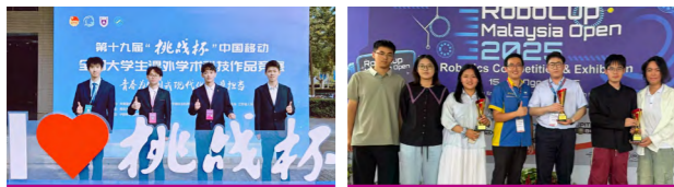
医学院学子斩获“挑战杯”全国大学生课外学术科技作品竞赛特等奖