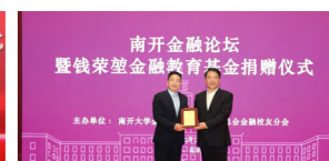
南开金融论坛暨钱荣堃金融教育基金捐赠仪式