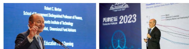
诺贝尔经济学奖获得者、麻省理工学院教授罗伯特·C·默顿做客百年南开大讲坛

学院与世界一流高校、国际组织和科研机构保持紧密合作，举办内容丰富的学术交流活动。