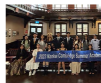
本科生参加英国剑桥大学暑期交流项目