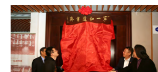
校友资助建成“宁一弘道书斋”