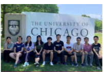
本科生访问美国芝加哥大学