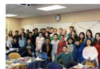
本科生参加伯克利交换项目

学院与美国加州大学伯克利分校、哥伦比亚大学、芝加哥大学、英国剑桥大学、伦敦政治经济学院等世界一流大学建立合作交流关系，为学生提供国际学习和交流机会。与香港大学、香港科技大学等知名高校签署合作协议，通过“学院直推”机制为学生搭建“留学直通车”。