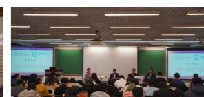
金融校友设立《专业学习与职业生涯规划》公开课