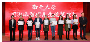
智德奖助学金颁奖

在国家和学校各类奖助学金的基础上，学院还设立专项奖助学金和研究性奖励赛事；设立金融学院学生职业发展中心，将生涯规划和就业指导纳入培养全过程。