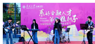
举办“融育华章”文化节