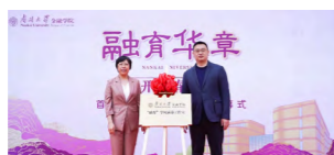
成立“融育”学风工作室