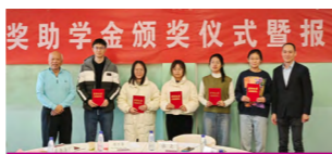
陈万华先生奖助学金颁奖仪式