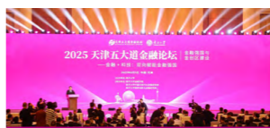
承办 2025 天津五大道金融论坛