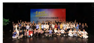
学生原创爱国主义精品话剧《张伯苓》剧照

学院围绕“强信念、强学术、强素养、强身心”四个“融合育人”维度，聚焦金融学子的家国情怀、学科能力、综合素养和身心健康，努力培养心有山海、创新卓越、融汇成长、刚毅乐群的新时代南开金融人才。