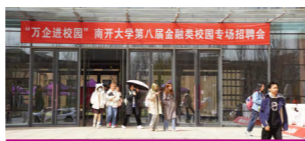
举办金融专场就业实习招聘会