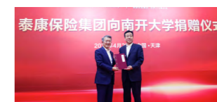
泰康保险集团向南开大学捐赠仪式

改革开放以来，南开金融、保险学科为中国现代化金融体系建设和行业发展培养了大批优秀人才。广大校友和社会各界积极捐资助学，支持学院建设发展。