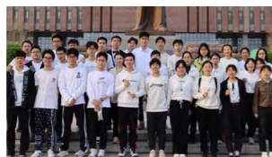
特色班学生参加班班唱合唱比赛