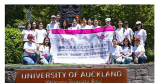
本科生参加“全球南开”公能人才成长计划