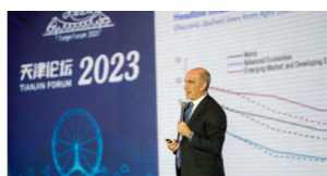
国际货币基金组织驻华首席代表史蒂夫·巴尼特出席天津论坛 2023