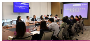
“名企零距离”企业走访活动