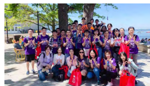
特色班学生在威斯康辛麦迪逊大学进行暑期交流学习

学院设立“钱荣堃班”和“智能金融领军人才”创新班，与外国语学院合作设立“保险+”多元语种双学位项目，开设“智能金融”微专业、“金融合规与反洗钱监管”微专业，在国内较早开设“技术转移硕士”学位项目，设有“金融支持科技创新的基础理论与关键方法”前沿交叉博士培养项目，新获批国家卓越金融人才培养基地，培养适应中国式现代化建设需要的特色拔尖人才。