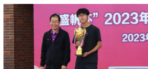
获得南开大学“校长杯”系列体育赛事总冠军