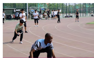
“桃李迎春”师生运动会

利用南开大学的综合资源，组织新入学的学生参加工程素质团队拓展训练，增强团队意识和合作技能。组织到科技企业参观，到境外进行国际交流，开阔视野，增长见识。每年，团委、学生会、科技社团举办文体活动、科技比赛、创新创业等各类文体科技活动，在紧张的学习之余，锻炼身体，舒缓身心。