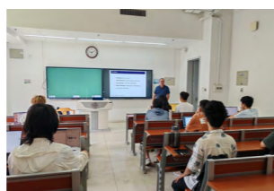
外教给本科生上课