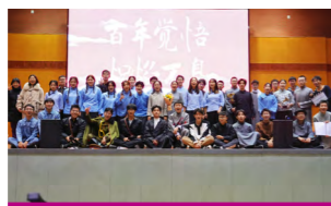
原创话剧《不屈烈焰》