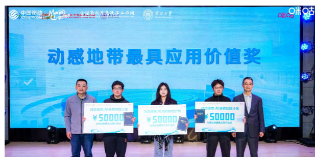
动感地带 AI+ 高校创智计划颁奖仪式