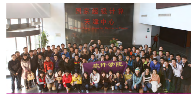
学生参观超算天津中心