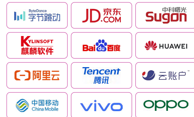
产学研合作部分代表性企业

采用理论和实践并重的人才培养模式，注重校企协同培养，共建实践基地，与字节跳动、阿里、京东、华为、腾讯、麒麟软件、中科曙光、vivo、中国移动、中软国际等企业积极开展校企合作，引入企业在校内开展项目制实训，推荐优秀学生赴知名企业实习，将理论学习与技能训练更好地结合，在实习实训中提高对专业知识的认知和使用。