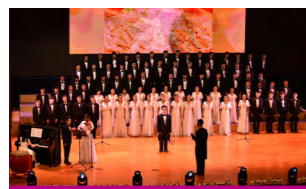
“五月的鲜花”合唱比赛