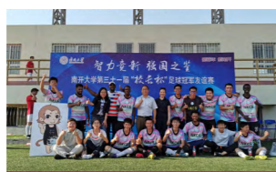
“校长杯”足球冠军友谊赛