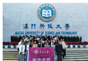
深港澳研学 - 澳门科技大学