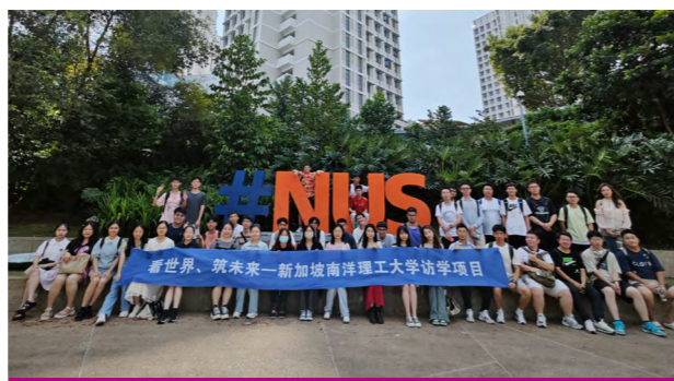
新加坡南洋理工大学交流访学

开设暑假寒假学生境外交流访问，定期邀请国际著名高校及科研机构专家，来我院交流讲学，举办国际学术交流会。拥有外籍教授 2 名，是商务部援外硕士生软件工程专业培养基地，每年接收留学生 45 人，持续提升学院国际化程度。